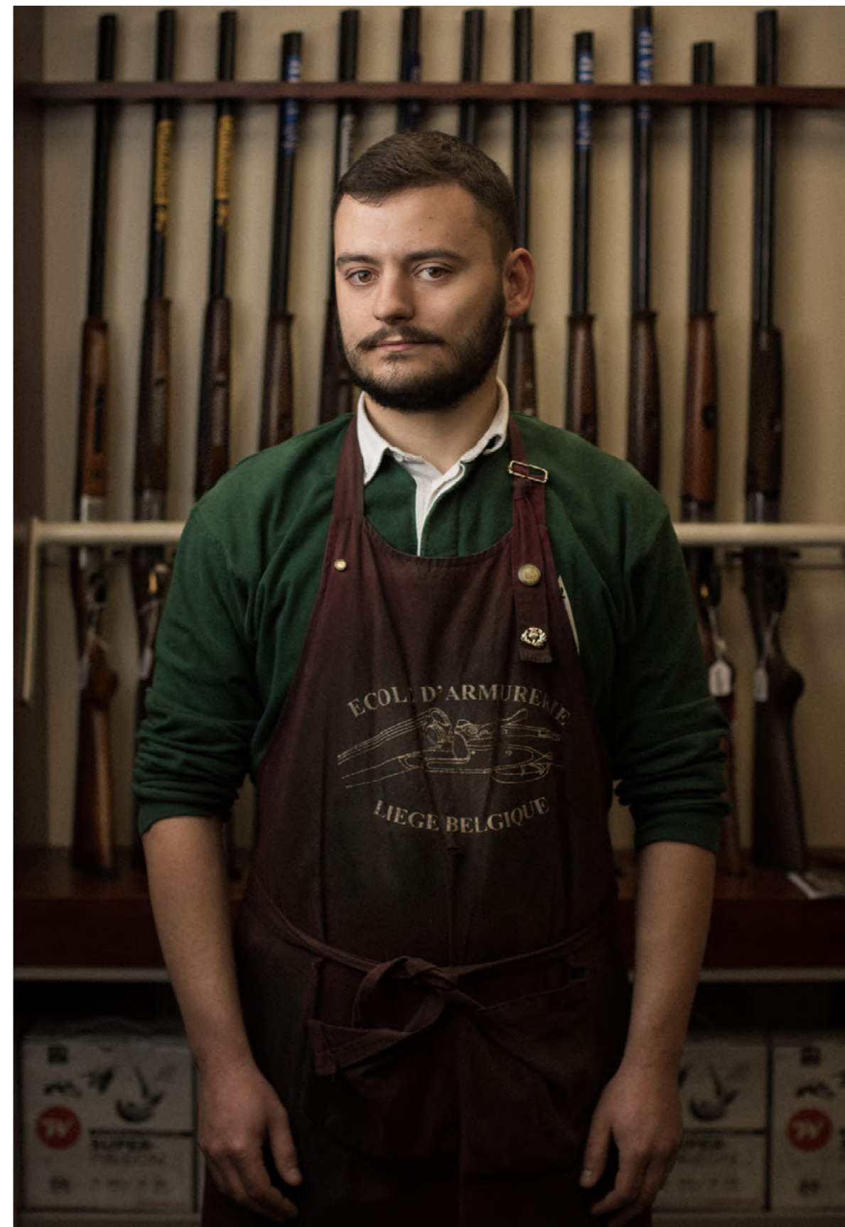
Portrait des rugbymenu ROC Mellois Magazine Raffut