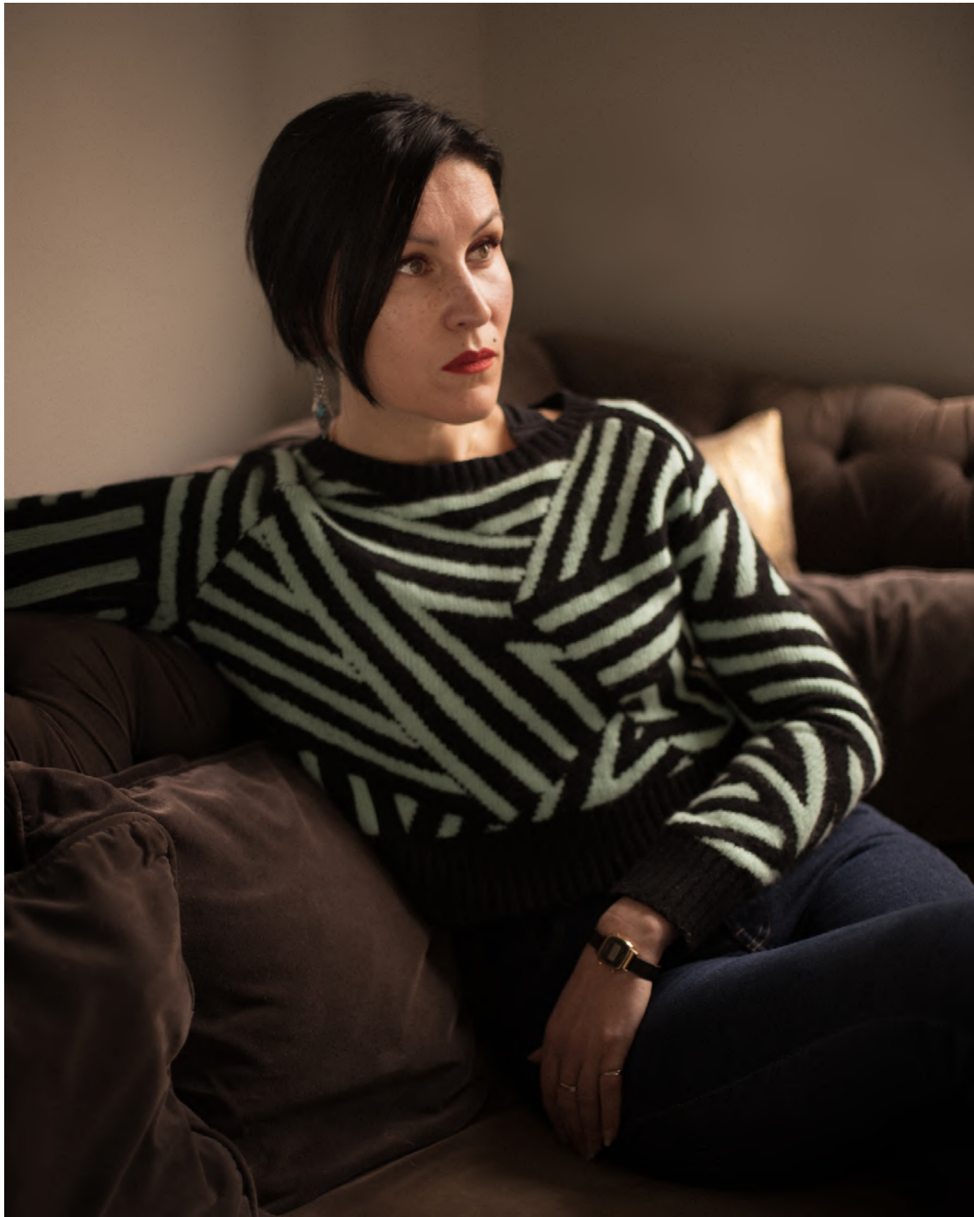
L'autrice et réalisatrice Ovidie