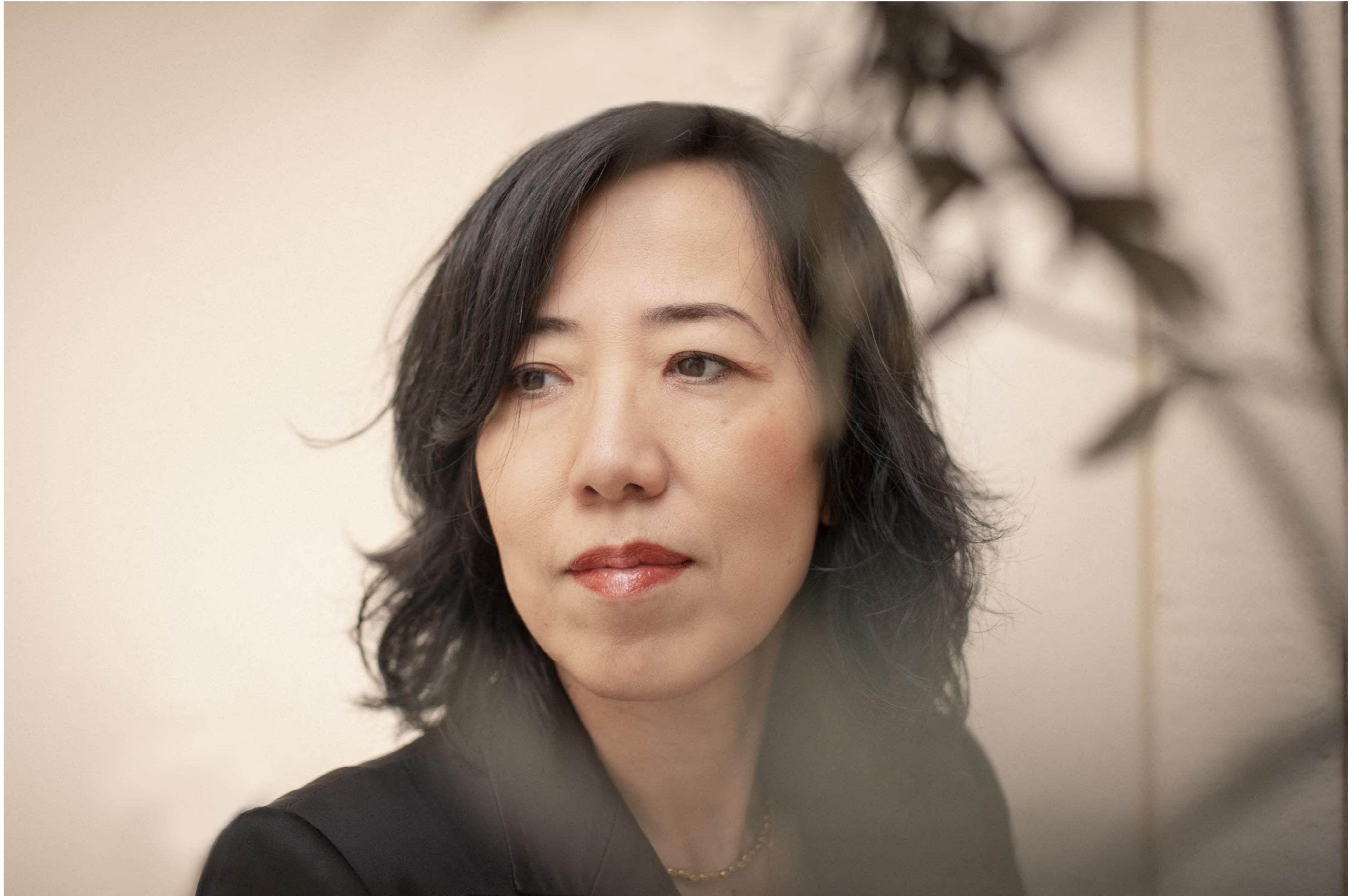
La poétesse Ryoko Sekiguchi Art Interview