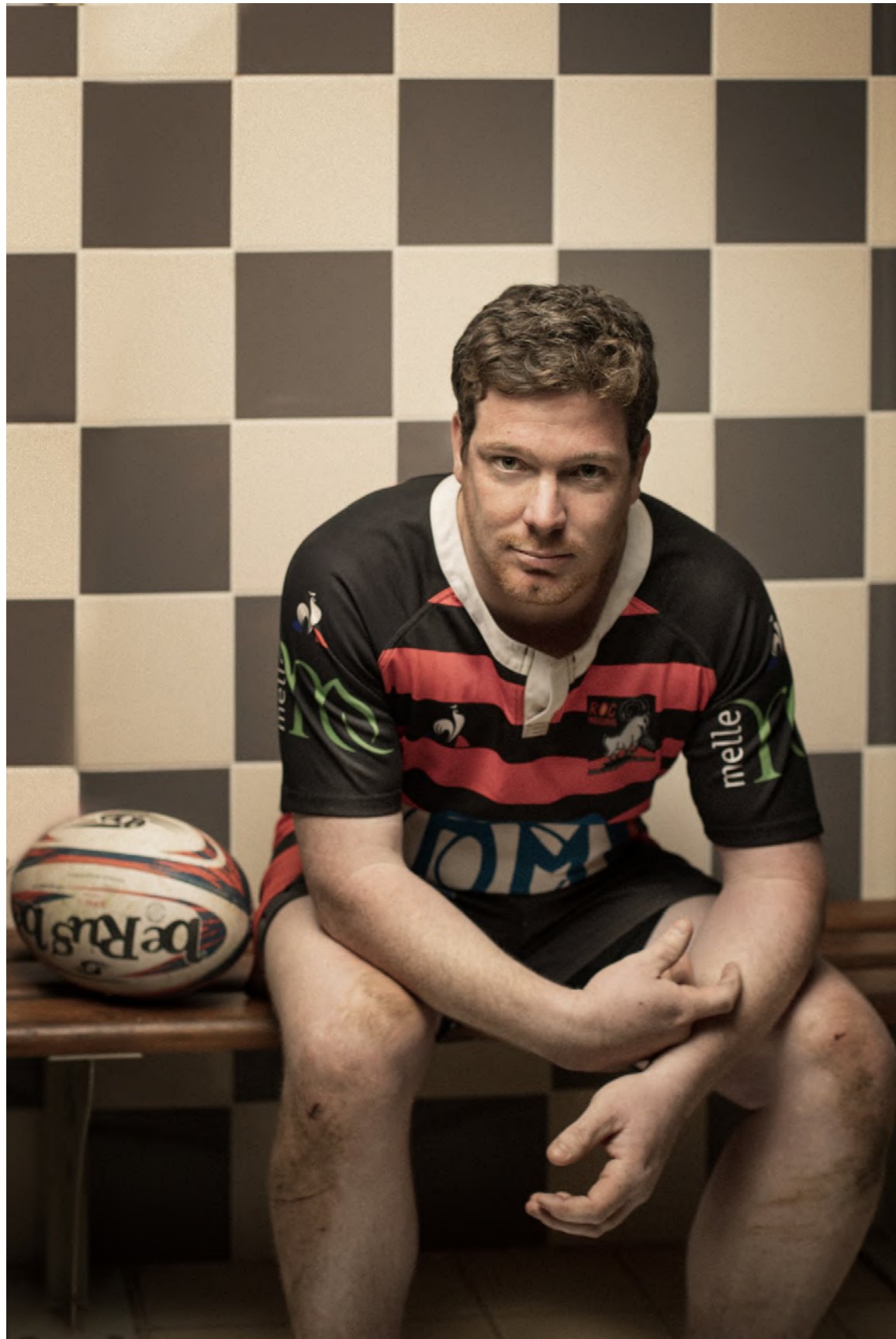
Portrait des rugbymendu ROC Mellois Magazine Raffut